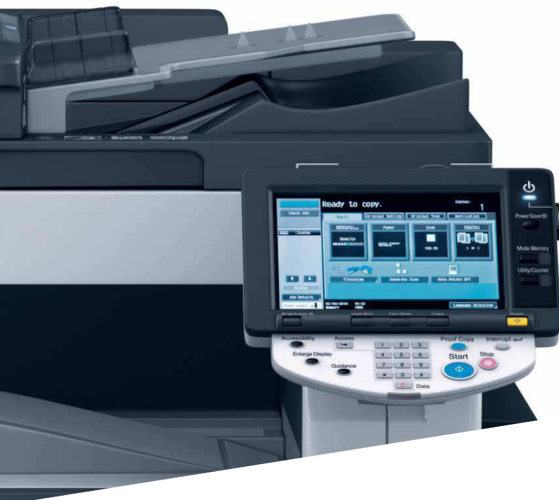
Das leicht bedienbare Farbdisplay der ineo 223

Die hohe Druckqualität in Verbindung mit einer großen Auswahl an Finishing-Funktionen ermöglichen es, selbst höherwertige Dokumente wie Broschüren inhouse zu drucken, zu lochen oder zu heften. Das steigert die Produktivität nachhaltig!