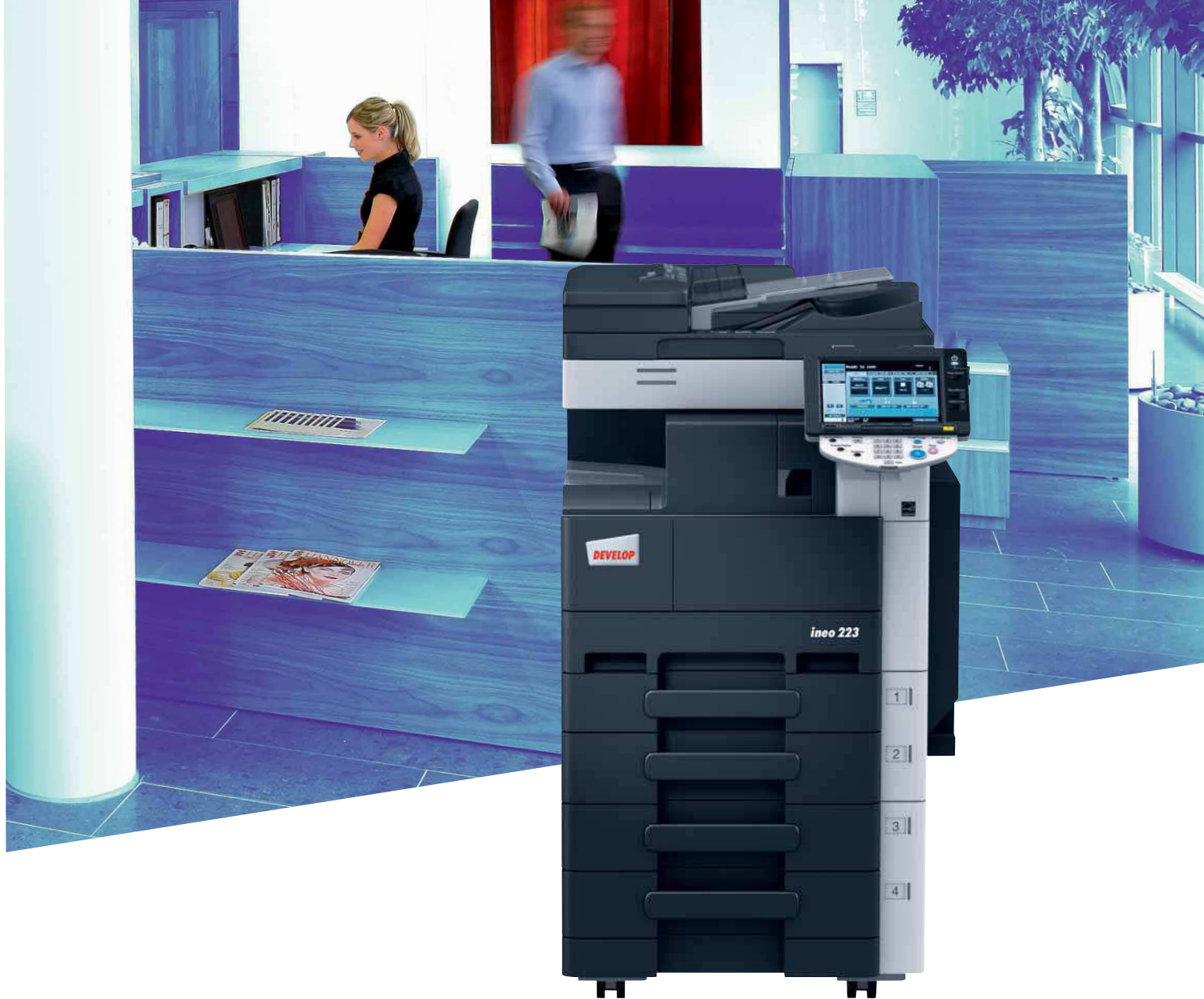
ineo 223 mit integriertem Heft-Finisher (FS-529), Papierkassette (PC-208) und Originaleinzug (DF-621)