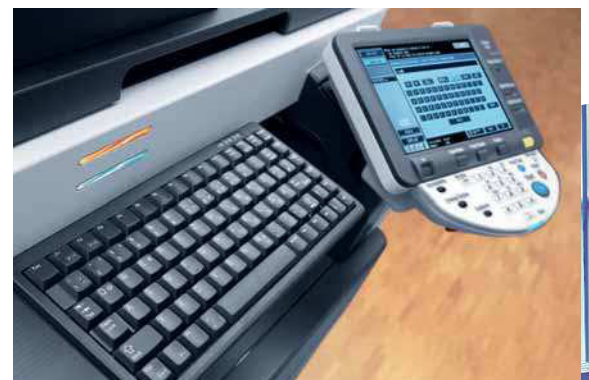
ineo 223 farbiges Touchscreen Display und optionale Tastatur für einfache Eingabe

Profitieren Sie von einem perfekten Team und nutzen Sie die ineo 223 für die Dokumentenproduktion in Schwarzweiß kombiniert mit den ineo+ Systemen für die Erstellung professioneller Farbdokumente.